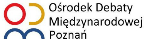
Ośrodek Debaty Międzynarodowej Poznań